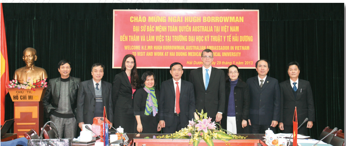
Làm việc với Đại sứ Australia tại Việt Nam tháng 1/2013 Working with the Australian Ambassador (1/2013)