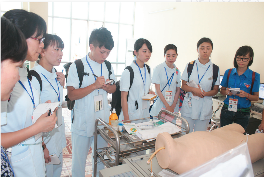
Năm thứ năm liên tiếp tổ chức thành công khóa thực tập điều dưỡng quốc tế cho sinh viên trường đại học điều dưỡng quốc gia Nhật Bản The Fifth international nursing practicum for NCNJ students at HMTU (August, 2015)