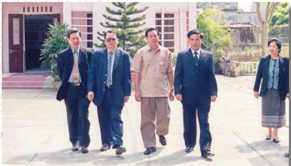
1. BS. Ponmeck Dalaloi - Bộ trưởng Bộ Y tế CHDNND Lào tới thăm và làm việc với Trường (tháng 9/2002) Dr. Ponmeck Dalaloi, Laos' Minister of Health, visited the school (September, 2002)