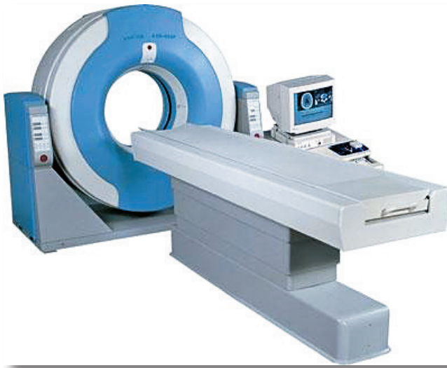
Máy chụp cắt lớp vi tính (CT Scanner)