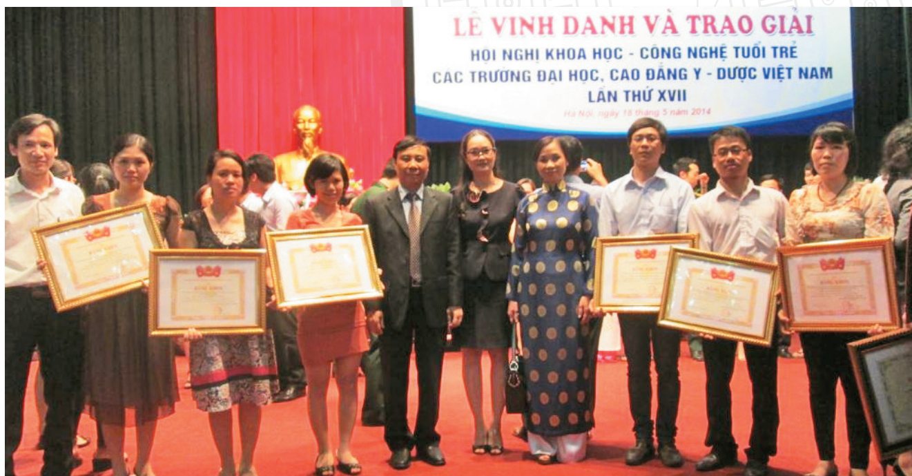
Các giảng viên của Trường đạt giải tại Hội nghị khoa học công nghệ tuổi trẻ các trường đại học, cao đẳng Y Dược Việt Nam (tháng 5/ 2014) The School's faculty participated in the Youth Science Conference of all Medical universities & colleges in Vietnam (May, 2014)