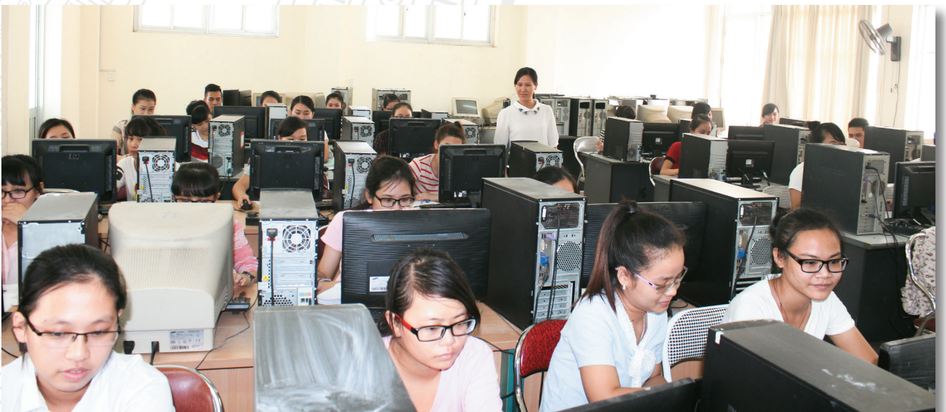
Phòng thực hành tin học The informatics practice room