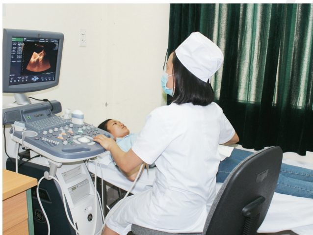
Máy siêu âm màu 4D 4-D ultrasound