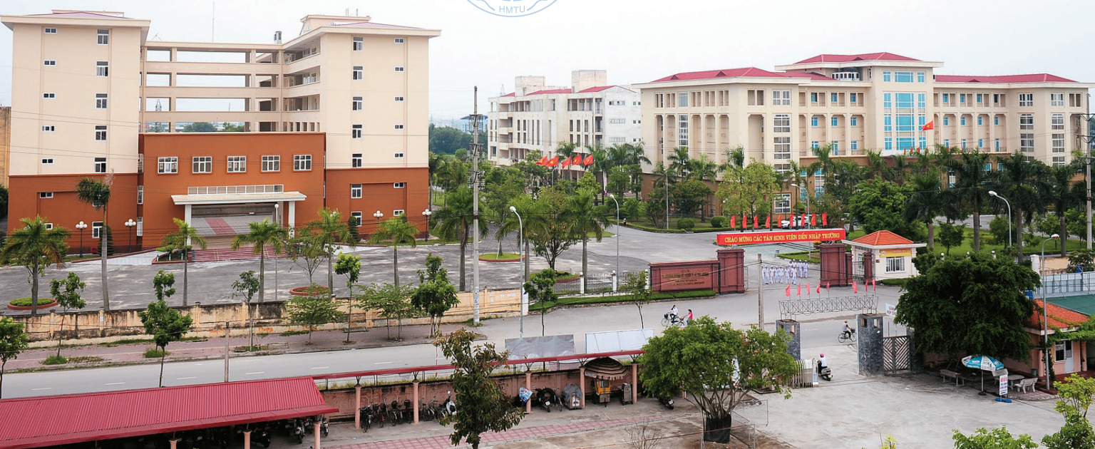
Toàn cảnh khu nhà điều hành, giảng đường thư viện và ký túc xá sinh viên (khu B) Overview of Administration Building Area, Lecture halls, Library, Dormitory (Zone B)