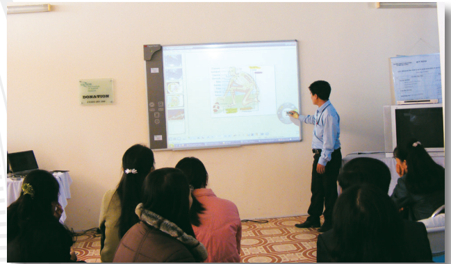
Phòng học có trang bị bảng thông minh (Digital Board)