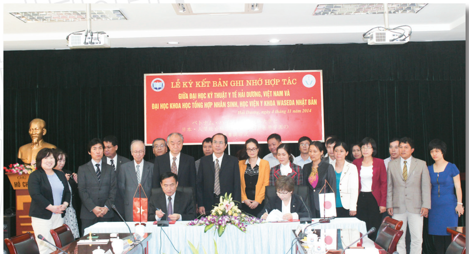
Ký kết bản ghi nhớ hợp tác giữa Trường Đại học Kỹ thuật Y tế Hải Dương và Đại học Tổng hợp Nhân sinh, Học viện y khoa WASEDA, Nhật Bản MOU signing with Waseda University, Japan (2014)