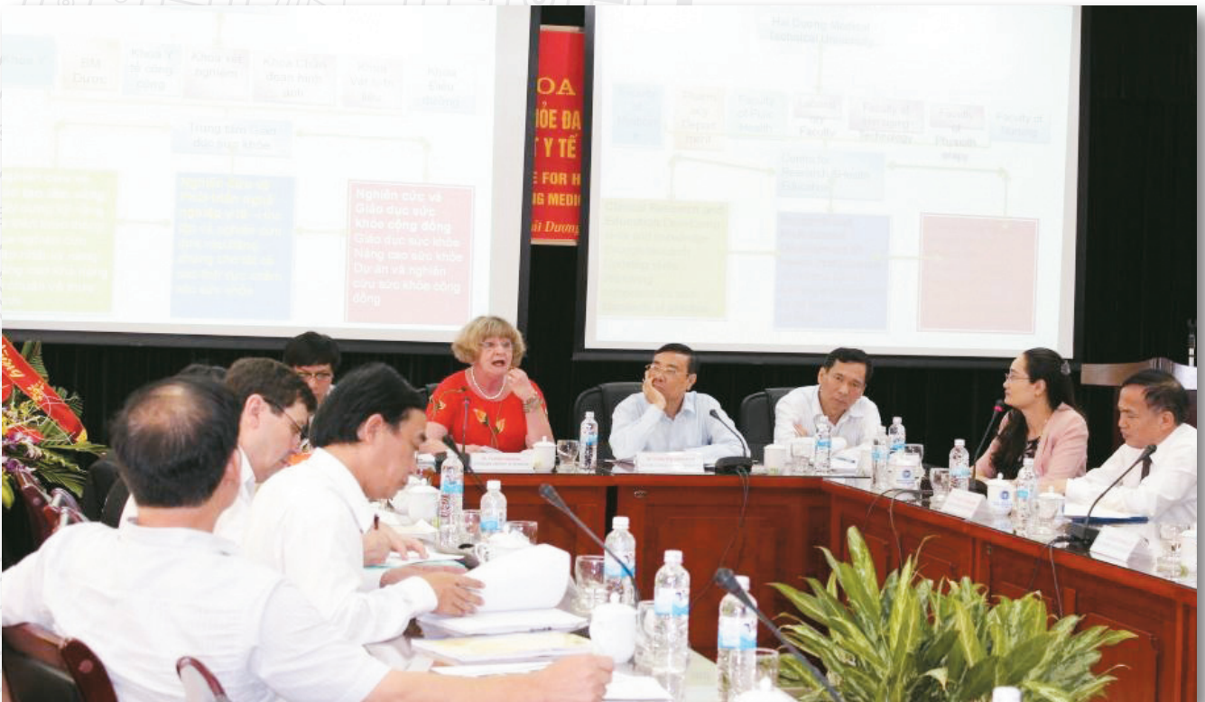
Phòng họp trực tuyến với các thiết bị Hội nghị truyền hình Meeting room with teleconference facilities