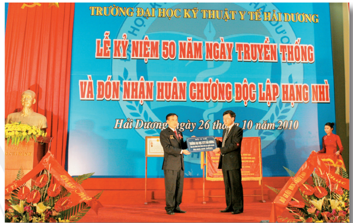
“Ủng hộ đồng bào bão lũ, thiên tai” “Support for blood - sufferers”

In addition, the school also supports, strengthen infrastructure such as medical bed, instrument trolley, blood pressure machine... for some health stations in Hai Duong Province, in collaboration with Hai Duong Red Cross Institute Central Blood Transfusion Hematology, Hai Duong Provincial General Hospital and other health care facilities organized for officials and employees, teachers and students voluntary blood donation service and level of treatment save the patients, are appreciated by the local health sector and international countries.