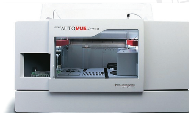
Hệ thống định danh nhóm máu và kháng thể System to classify blood groups