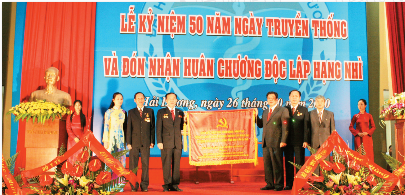
Đồng chí Bùi Thanh Quyển, UVTW Đảng, Bí thư tỉnh ủy Hải Dương trao tặng bức Trường của BCH Đảng bộ tỉnh Hải Dương cho Nhà trường nhân dịp 50 năm ngày truyền thống nhà trường (tháng 10/2010)

HMTU honored as one of the 13 units outstanding achievements of the health sector in 2013 received the Government's Emulation Flag by H.E.Mr.Vu Duc Dam - Deputy Prime Minister (27, February, 2014)