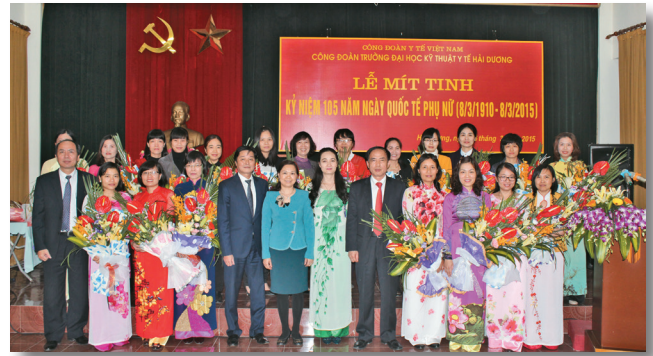
"Công đoàn Trường Đại học Kỹ thuật Y tế Hải Dương tổ chức Lễ kỷ niệm 105 năm ngày Quốc tế Phụ nữ (tháng 3/2015) "HMTU Trade Union held 105 years' Anniversary of Women's Day (March, 2015)

Tổ chức Công đoàn Trường đã thực hiện tốt chức năng giám sát và tham gia quản lý Nhà trường, phối hợp với chính quyền chăm lo đời sống vật chất, tinh thần cho CBVC & HSSV góp phần tích cực cho Trường hoàn thành xuất sắc nhiệm vụ được giao.