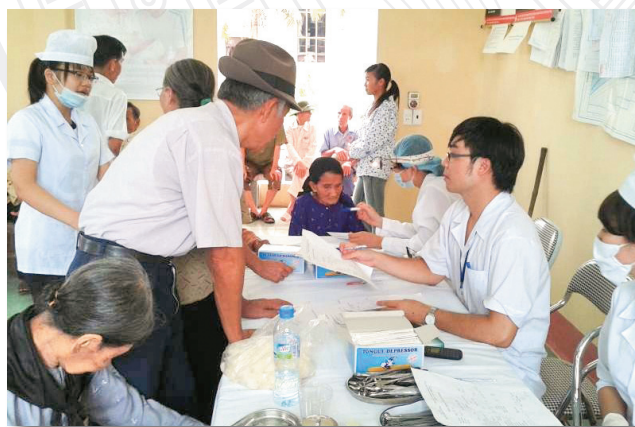
Khám sức khỏe và cấp thuốc miễn phí cho các đối tượng chính sách nhân ngày 27/7 Freely examining & providing medicine for special people on 27/7