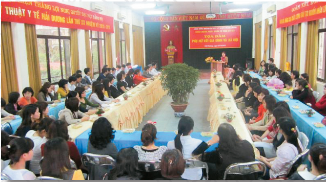
Ban nữ công Trường tổ chức tọa đàm về đổi mới phong cách giao tiếp ứng xử School Women's Affairs held talks on renewing communication style