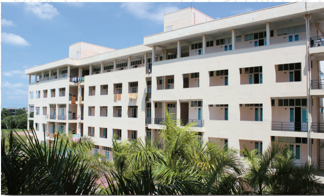
Khu ký túc xá sinh viên Students' contained dormitory

Là một trường đào tạo kỹ thuật nên Nhà trường đặc biệt chú ý đã tăng cường bổ sung nhiều máy móc, trang thiết bị hiện đại phục vụ cho dạy - học như máy siêu âm màu 4 chiều, máy xquang kỹ thuật số, máy xquang chụp vú, máy nội soi dạ dày có kết nối camera, nội soi cổ tử cung, máy xét nghiệm hoá sinh tự động, máy xét nghiệm huyết học 26 thông số, máy XN hoá miễn dịch phát quang, máy CT scanner 16 lát cắt, hệ thống định danh nhóm máu và kháng thể, labo phục hình răng, labo xét nghiệm An toàn vệ sinh thực phẩm, Độc chất học và Dinh dưỡng - Tiết chế, xét nghiệm sinh học phân tử, xây dựng 3 nhà ký túc xá 5 tầng có chỗ ở cho hơn 1000 sinh viên và 01 nhà điều hành; xây dựng thêm nhiều phòng học có trang bị phương tiện dạy học hiện đại, đã đầu tư trang thiết bị cho giảng đường 300 chỗ tại Bệnh viện đa khoa tỉnh Hải Dương, máy chiếu cho giảng đường tại Bệnh viện 7 - Quân khu 3 và mua sắm nhiều trang thiết bị hiện đại khác phục vụ đào tạo thực hành chuyên ngành Trường đang đào tạo.