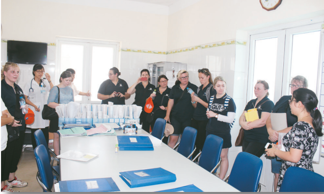
Tổ chức thành công khóa thực tập quốc tế năm 2015 cho các sinh viên trường Đại học Công nghệ Queensland (QUT) Australia. Organised the International Practice for QUT students (July, 2015)