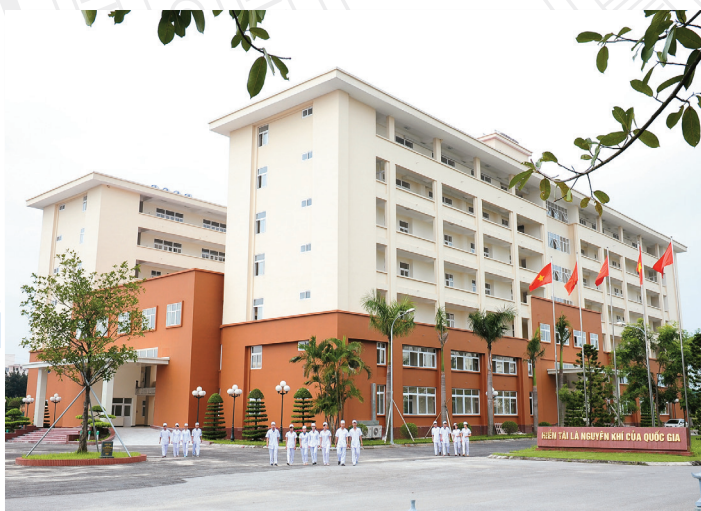
Tòa nhà giảng đường thư viện Lecture halls & Library Building