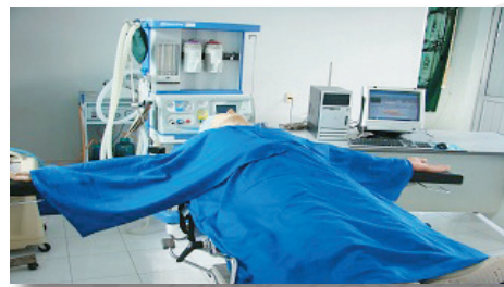
Máy gây mê, bàn mổ và mô hình gây mê hồi sức kết nối máy tính Anesthesia and ventilation apparatus with PC control