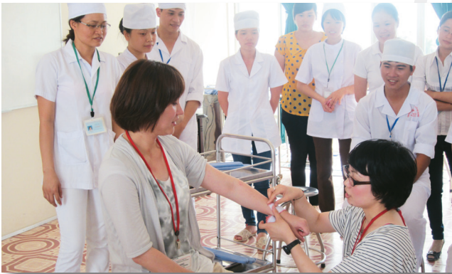
Đoàn giảng viên và Điều dưỡng Nhật Bản đến tham quan, học tập và chia sẻ kinh nghiệm tại Trường (tháng 7/2012) Japanes lectures and nurses visited and exchanged at HMTU (July, 2012)