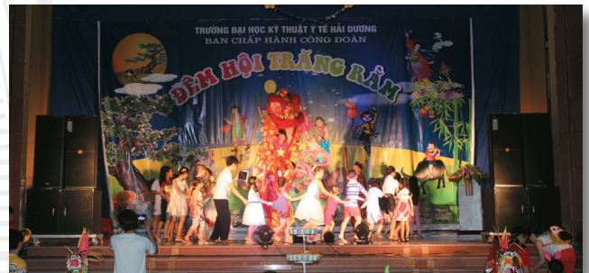
Công đoàn trường tổ chức đêm hội trăng rằm cho các cháu thiếu nhi Trade unions organizing the full-moon night for the children

Trade union organization has performed monitoring functions and participated in school management, in coordination with the authorities care for the material and spiritual life for staffs & students to contribute positively to the successful completion of the task assigned.