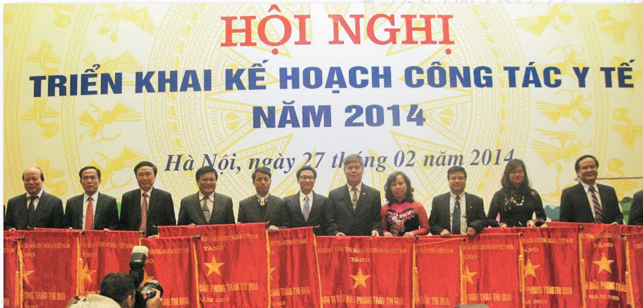
Trường Đại học Kỹ thuật Y tế Hải Dương vinh dự là một trong 13 đơn vị có thành tích xuất sắc của ngành Y tế năm 2013 được nhận Cờ thi đua của Chính phủ do Phó Thủ tướng Chính phủ Vũ Đức Dam trao tặng nhân ngày 27/2/2014

HMTU honored as one of the 13 units outstanding achievements of the health sector in 2013 received the Government's Emulation Flag by H.E.Mr.Vu Duc Dam - Deputy Prime Minister (27, February, 2014)