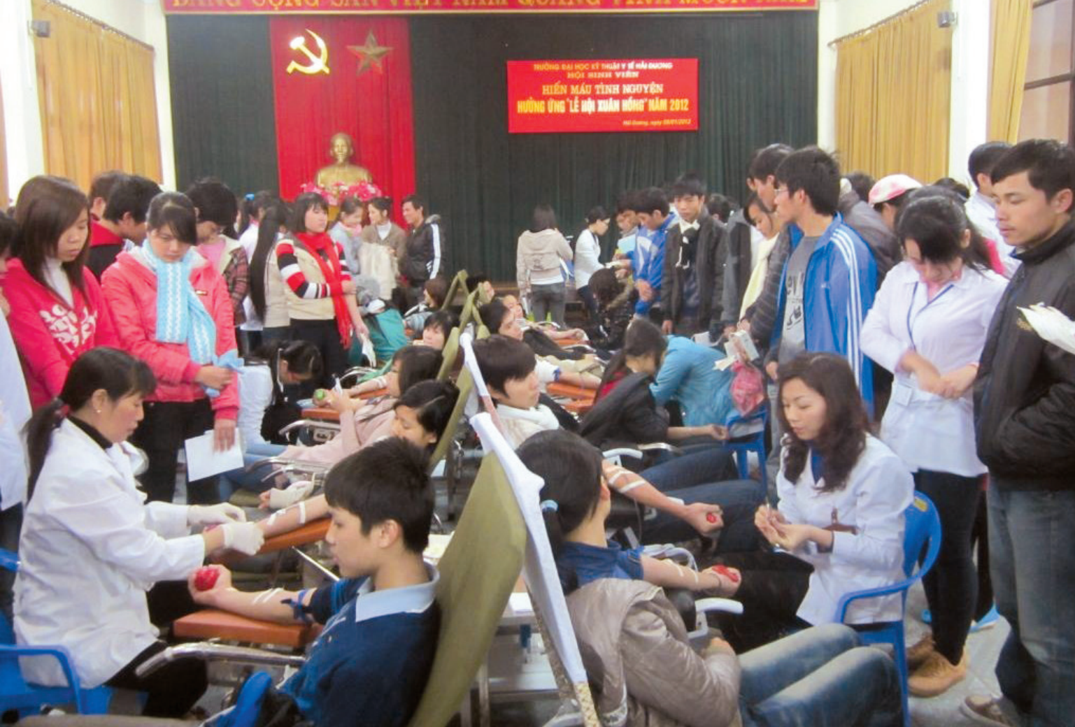
Hiến máu tình nguyện Voluntary blood donation