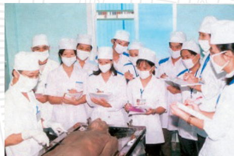
Thực hành giải phẫu Anatomy practice