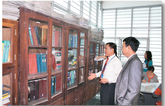
Thư viện mở và thư viện truyền thống với hơn 50.000 cuốn sách The Open Library & Traditional library with more than 50,000 books