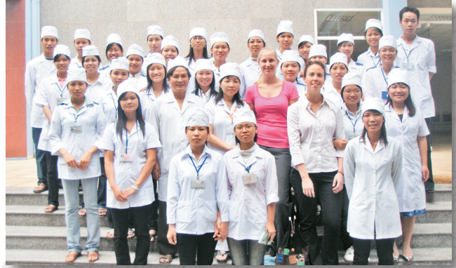
Sinh viên Trường Newcastle - Australia thực tập về Dinh dưỡng - Tiết chế tại Trường và Bệnh viện Students from Newcastle University - Australia prepared for their final project on Nutrition and Dietetic